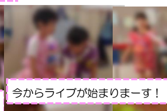
今からライブが始まりまーす！