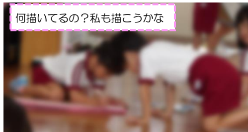
何描いてるの？私も描こうかな