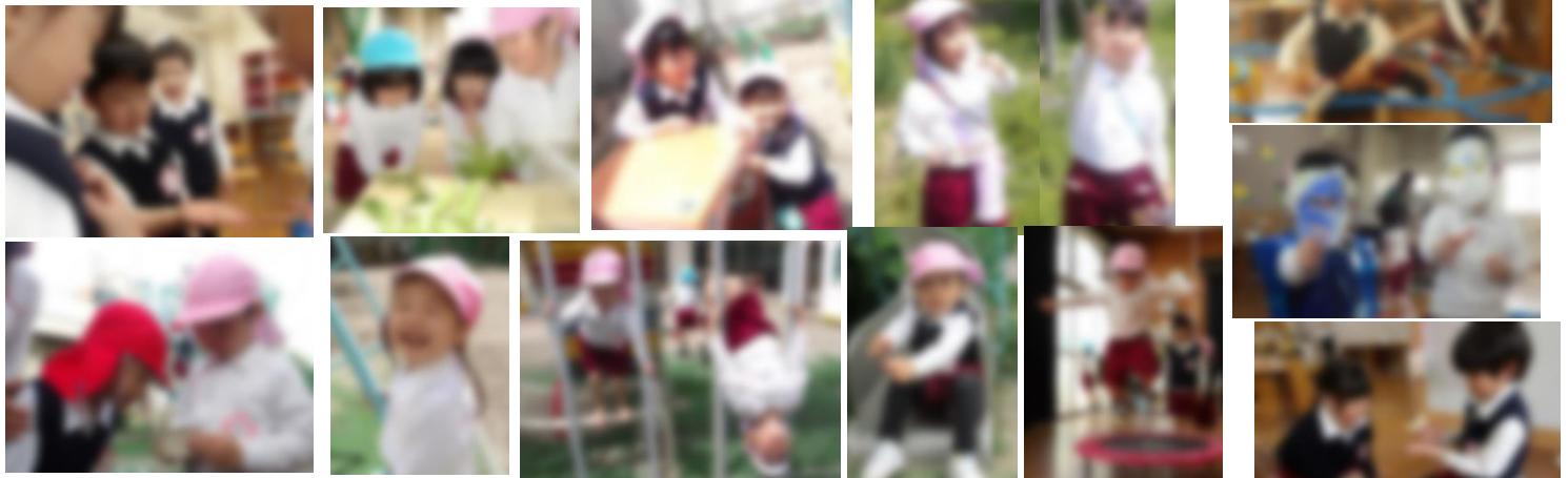
そら組さんとお散歩♡ 楽しかったね！

あか組の時に育てていたアオムシも蝶になり、みんなでそっと触ってみたり見送ったりしました。アオムシがたくさん生まれていることもそら組さんに教えてもらい、また新たな命をみんなで育て始めました。小さな生き物と触れ合い、成長を観察し喜びながら、小さな命を大切に感じる経験になってほしいと思います。