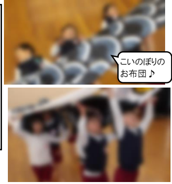
こいのぼりのお布団♪

かいたりつくったりしたもので大好きなキャラクターになったり、音楽に合わせて踊ったり、友達とおうちごっこやお店屋さんをしたりするなど、毎日「楽しい！大好き！」の思いが溢れながら遊んでいます。これからの1年、どんな楽しい遊びが広がっていくのか、とても楽しみです。