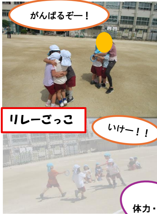
がんばるぞー！ リレーごっこ いけー！！

すくすくポイント 子どもの姿 つぶやき 遊びや生活の中での学びや育ち 幼稚園の教育で大切にしているところです。 お子さんの写真と合わせてご覧ください。