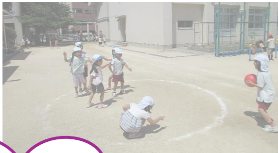
転がしドッジボール