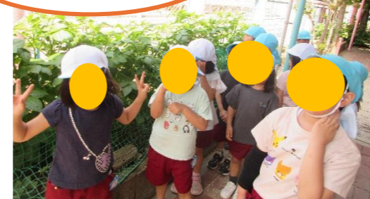
ジャガイモの葉っぱ 大きくなって！