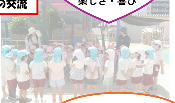
大淀保育所のつき組さん また一緒に遊ぼうね♡