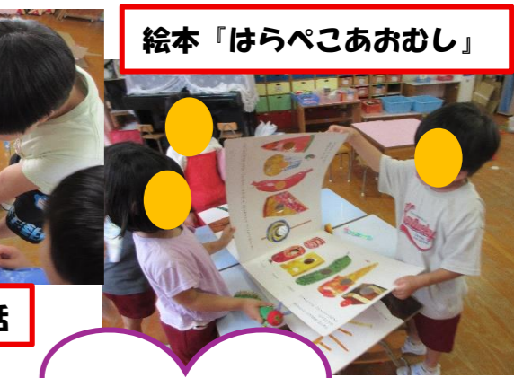
絵本「はらぺこあおむし」