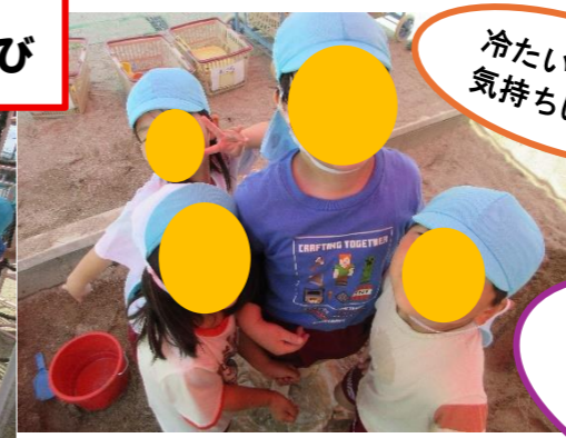
冷たい！ 気持ちいい〜