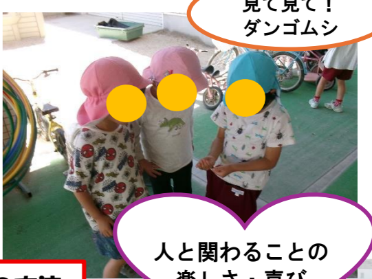
見て見て！ ダンゴムシ